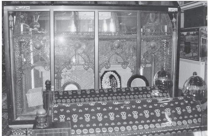
イブン・アラビー廟の内陣。緑色のガラスケースに、アラビーの棺が入っている。廟は、ダマスカスの街を一望するカシオン山の中腹にある

もともと、彼はスーフィーの大きな共同墓地に埋められました。彼の弟はスーフィーで、記録によるとその隣に埋められていたらしいです。ただ、その後、戦