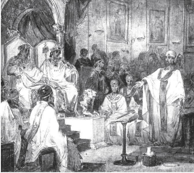
ロシアの画家ワシーリー・スリコフが描いた「第四全地公会議（カルケドン公会議）」（1876年。ロシア美術館所蔵）

子・イエスも神が創ったものの一つだということですが、 ところが、キリスト教の不思議なところは、合理的