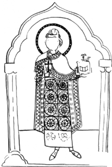
ロシアの「ヒッポリュトスの論集」写本にあるシメオン帝の細密画とその復元図