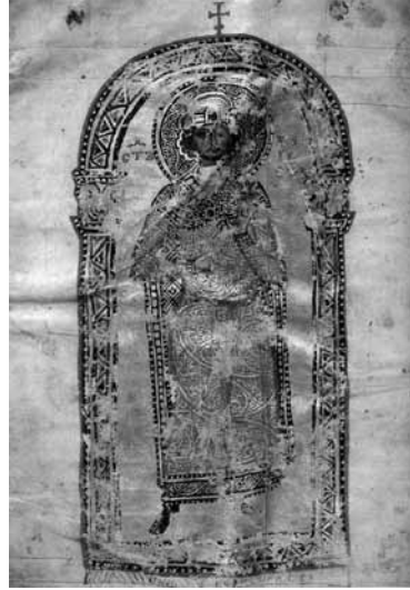
ロシアの「説教福音書」写本にあるボリス公の細密画

この細密画は、極めてシンプルな彩飾が印象的な論集——冒頭の文字は輪郭が2重線で書かれ、紫に着色されている——に収められて出版された。その手稿本は、2葉目に章頭飾りがなく、また他の細密画も収められていない。この点は、このブルガリア君主の細密画が古ブルガリアの手稿本から写して、後年のロシアの文集に載せられたという説を裏づける論拠のひとつになっている。この図像が写本に収められたのは、ブルガリアの人々をキリスト教に改宗させたという彼の